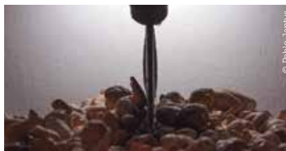
Sin título. De la serie "De la vida cotidiana". Silvio Fischbein, 2016. 32,5 cm x 32,5 cm x 90 cm. Madera, hierro, cerámica, resina epoxi, luz led.