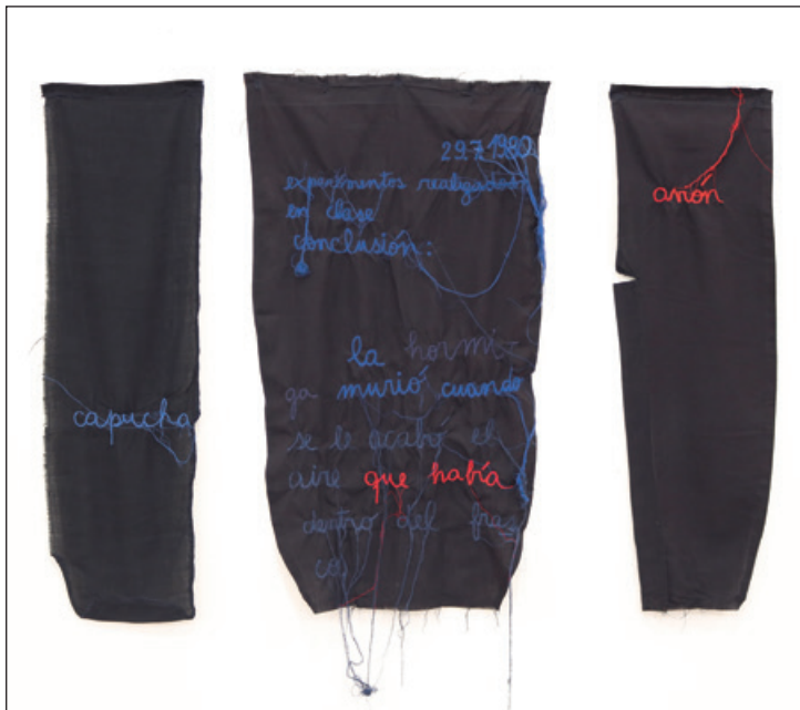
Arriba: "Querida Louise". Instalación, Florencia Walfisch.