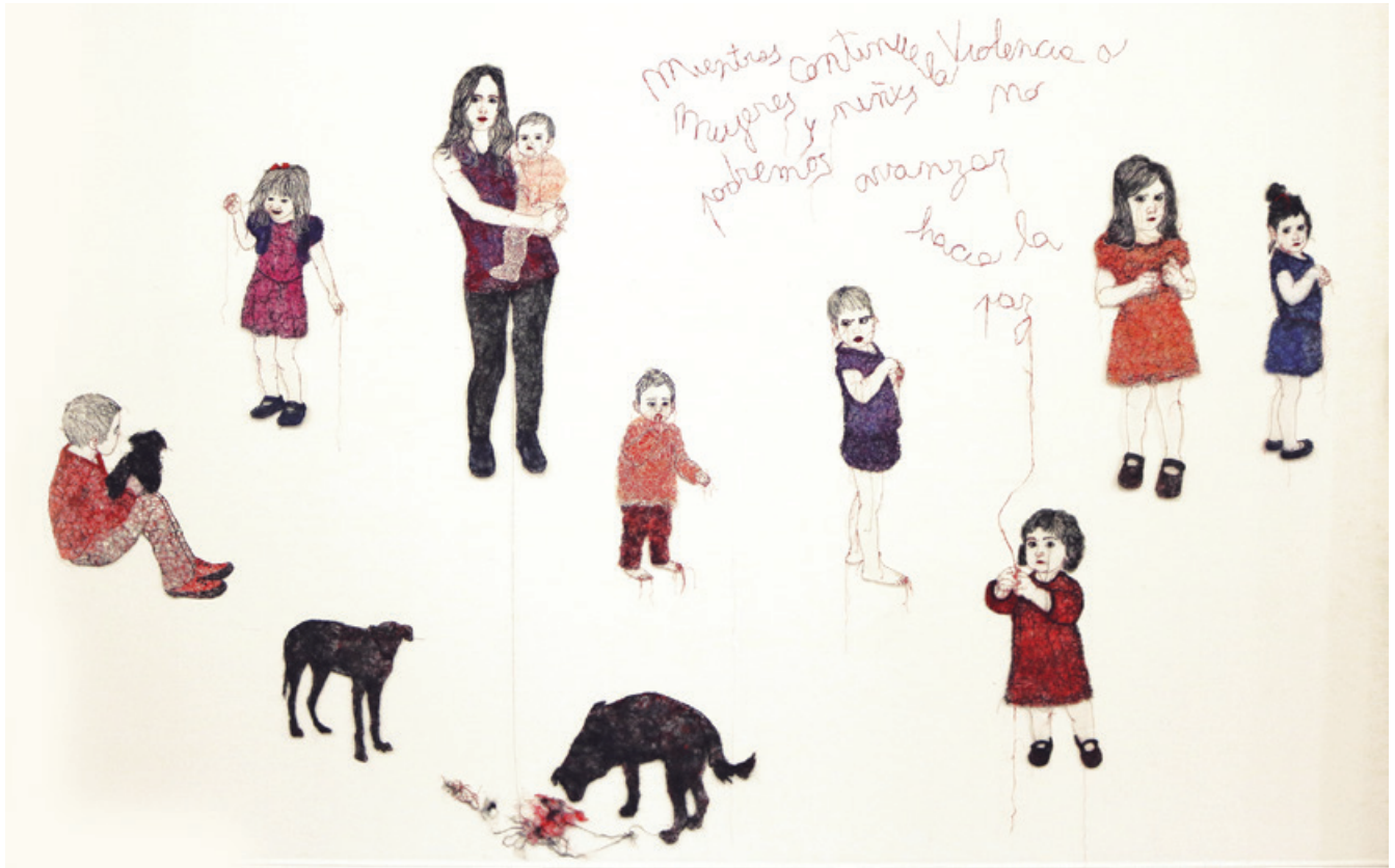
"Jazmín escribe en el aire", Carmen Imbach Rigos.