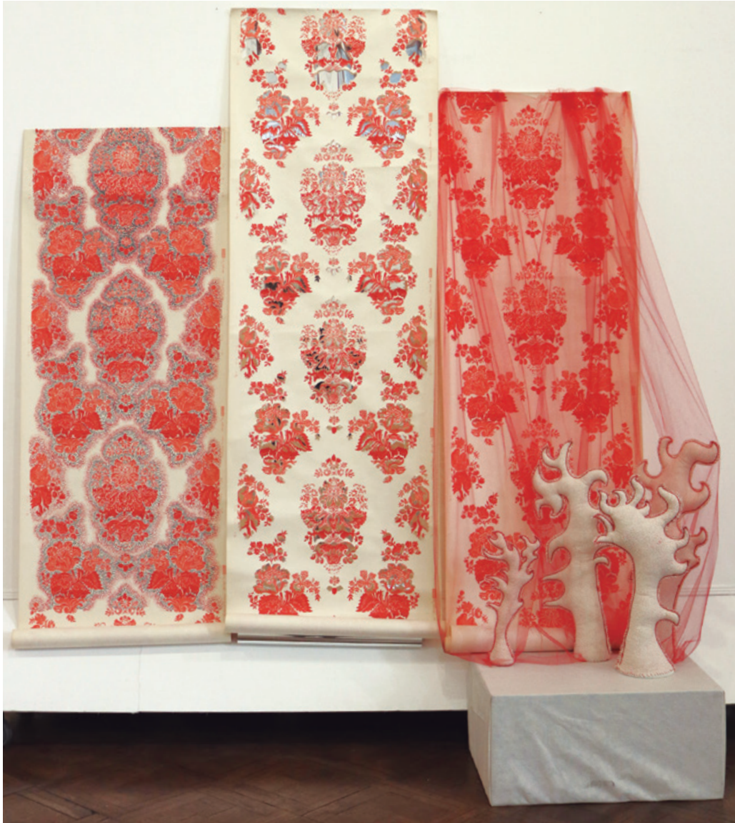
“La matriz”. Instalación, Marisa Domínguez.