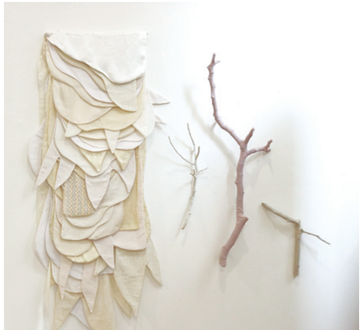
Abajo: "Jardines ancestrales", Natalia Suárez.