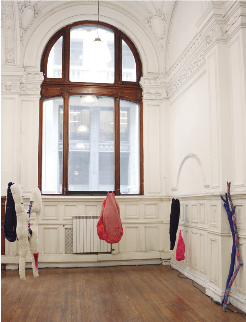
“Querida Louise”. Instalación, Florencia Walfisch.