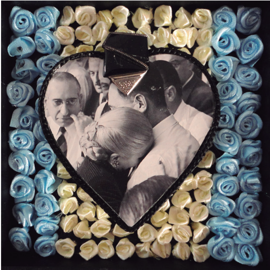
12 x 12 cm, impresión-tela-piedras, 2015.