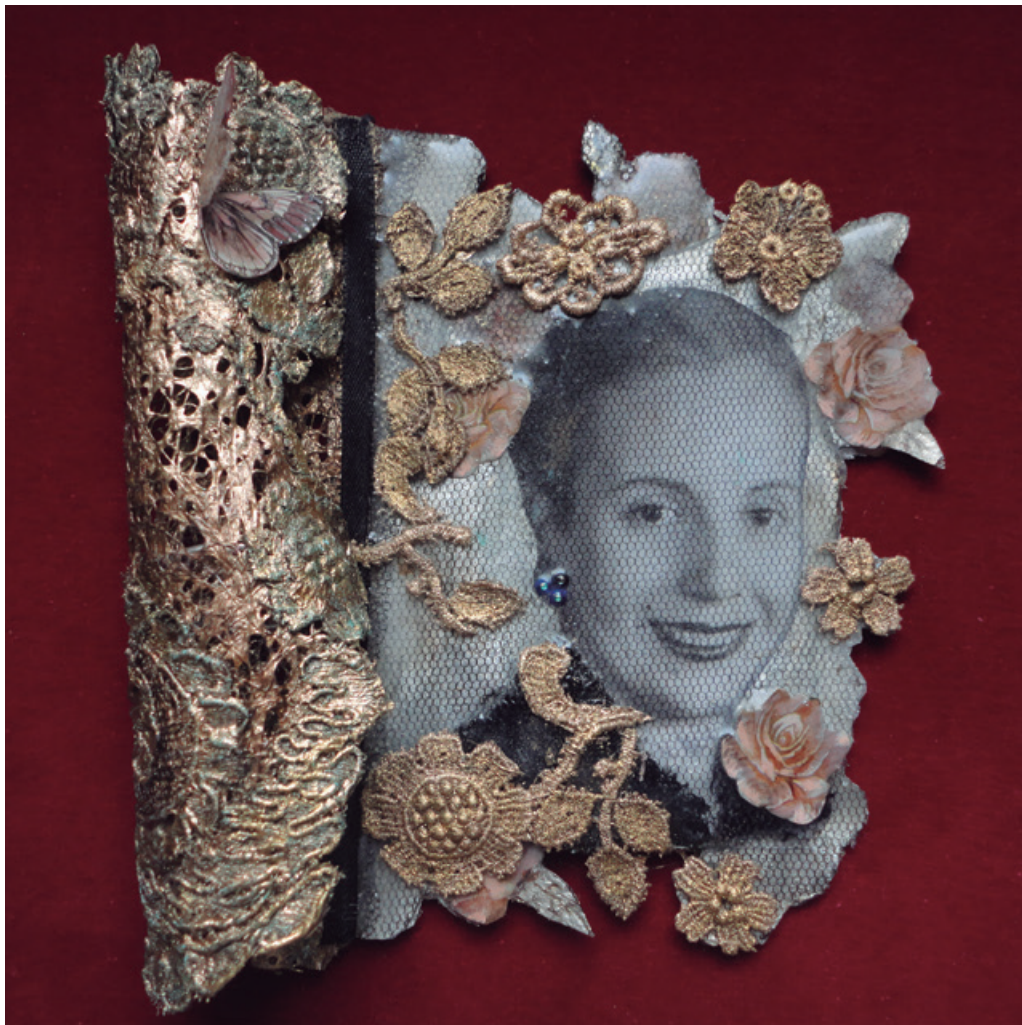
20 x 20 cm, pana-dorado a la hoja-resina, 2017.