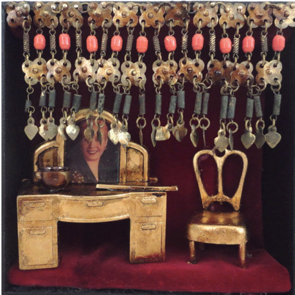
12 x 12cm, dorado a la hoja-piedras, 2016.