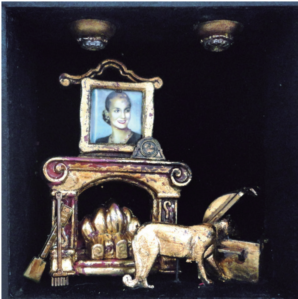
12 x 12 cm, dorado a la hoja-pana, 2016.