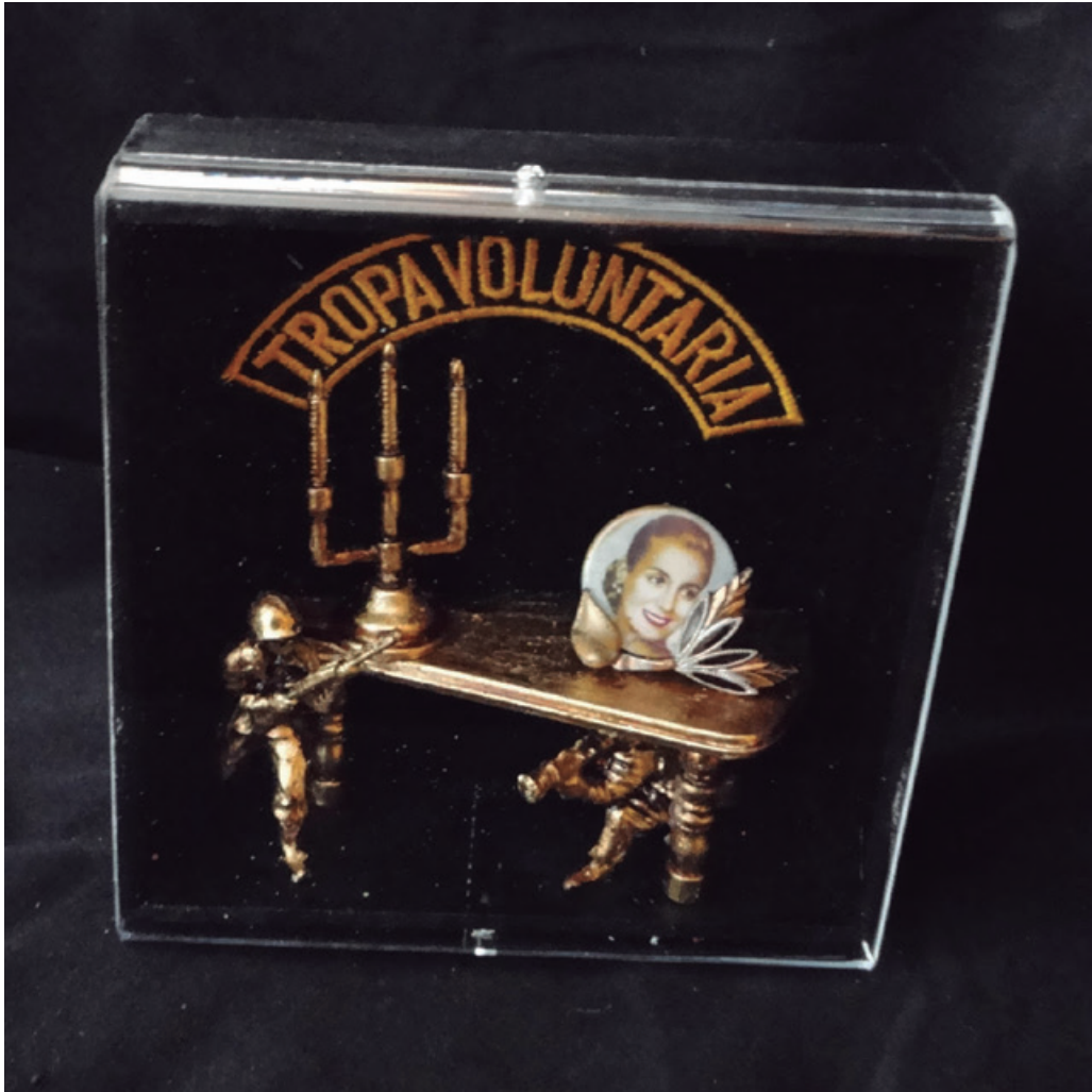
12 x 12 cm, dorado a la hoja-pana, 2016.