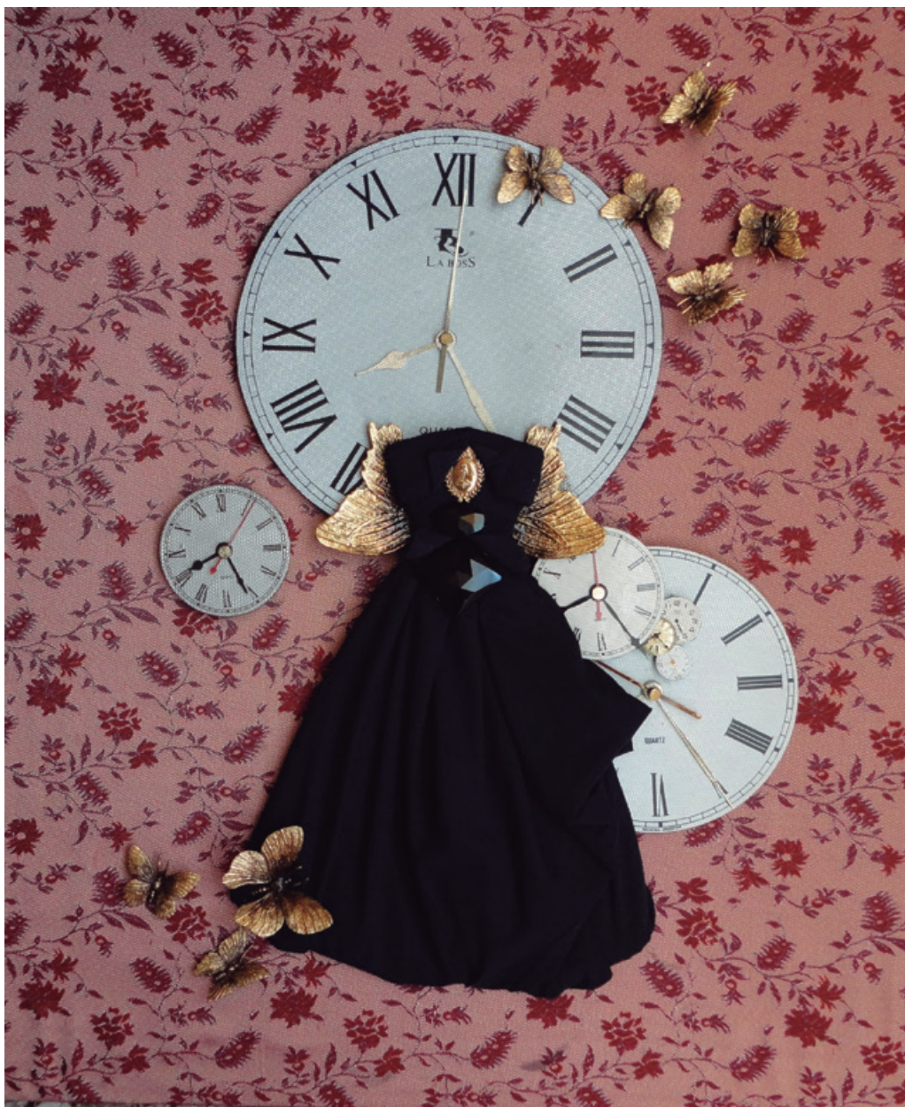
50 x 60 cm, brocato-seda-dorado a la hoja, 2016.