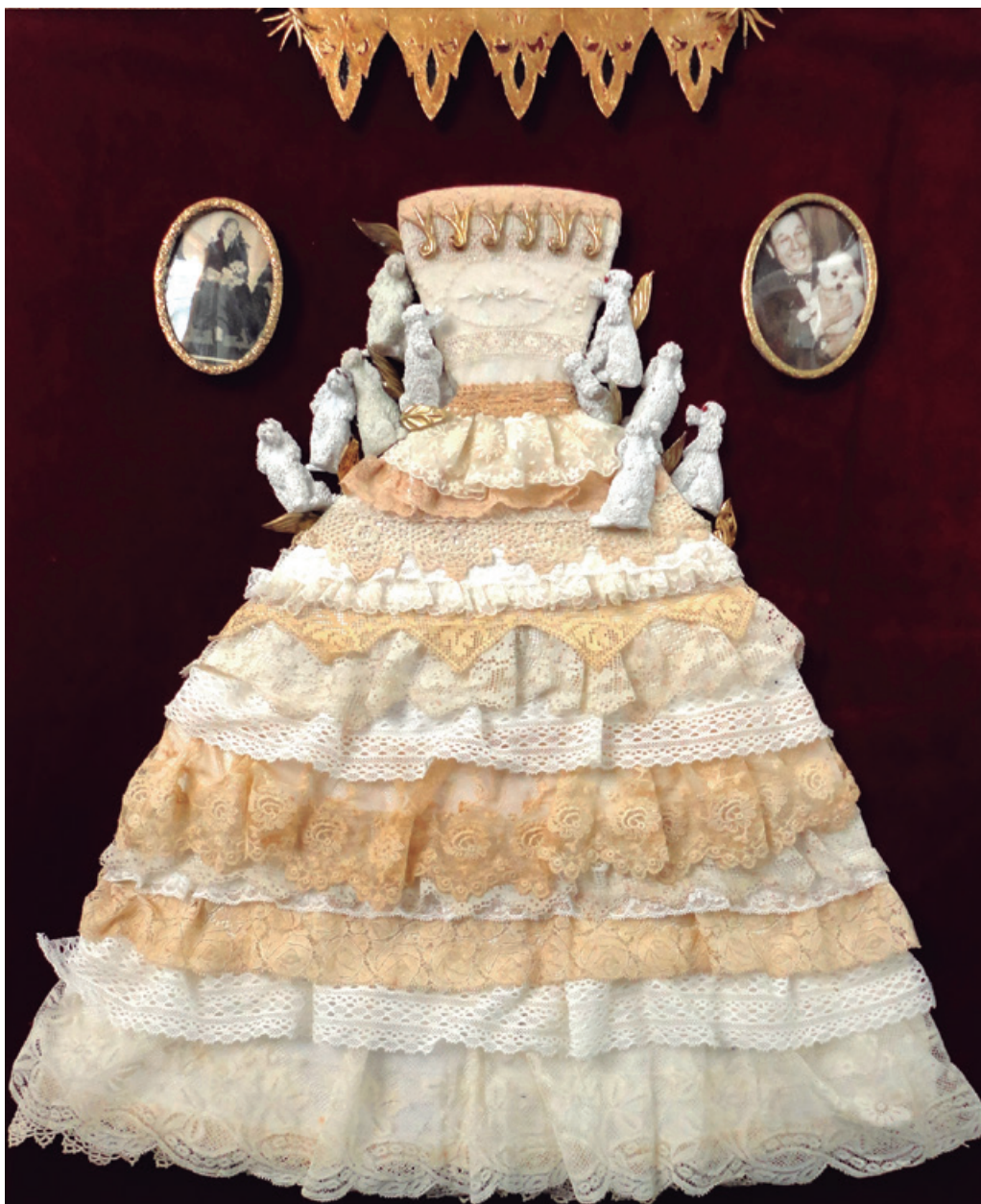
45 x 65 cm, pana-dorado a a la hoja-puntillas, 2015.