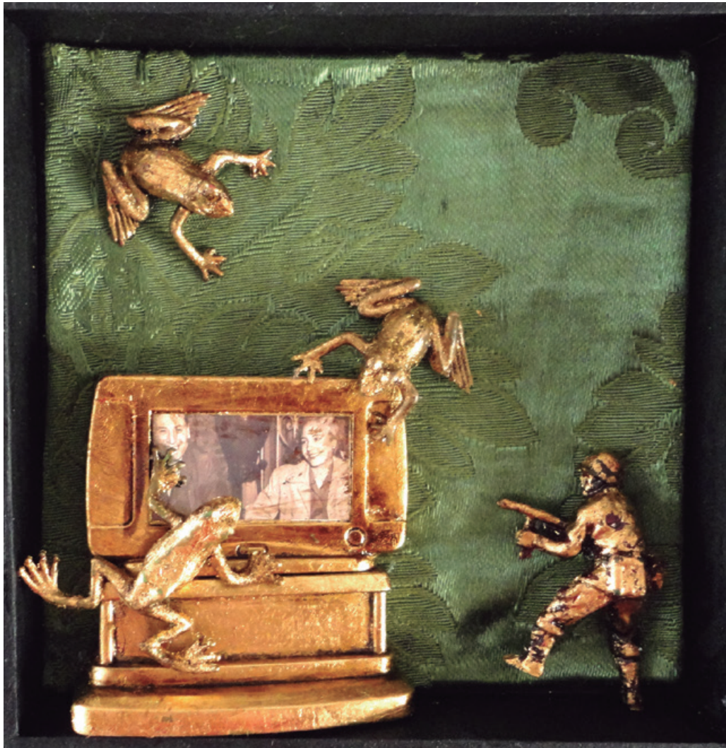
12 x 12 cm, brocato-dorado a la hoja, 2014.