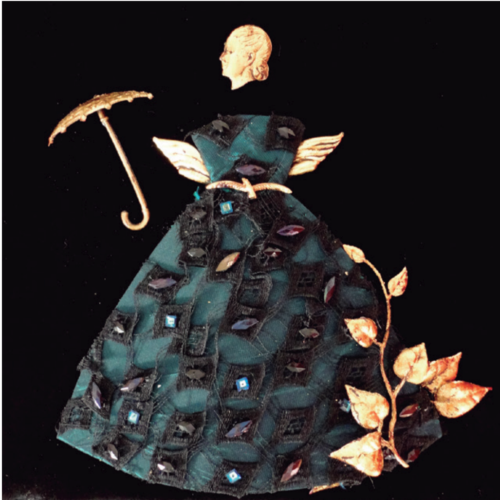
45 x 45 cm, pana-encaje-dorado a al hoja, 2016.