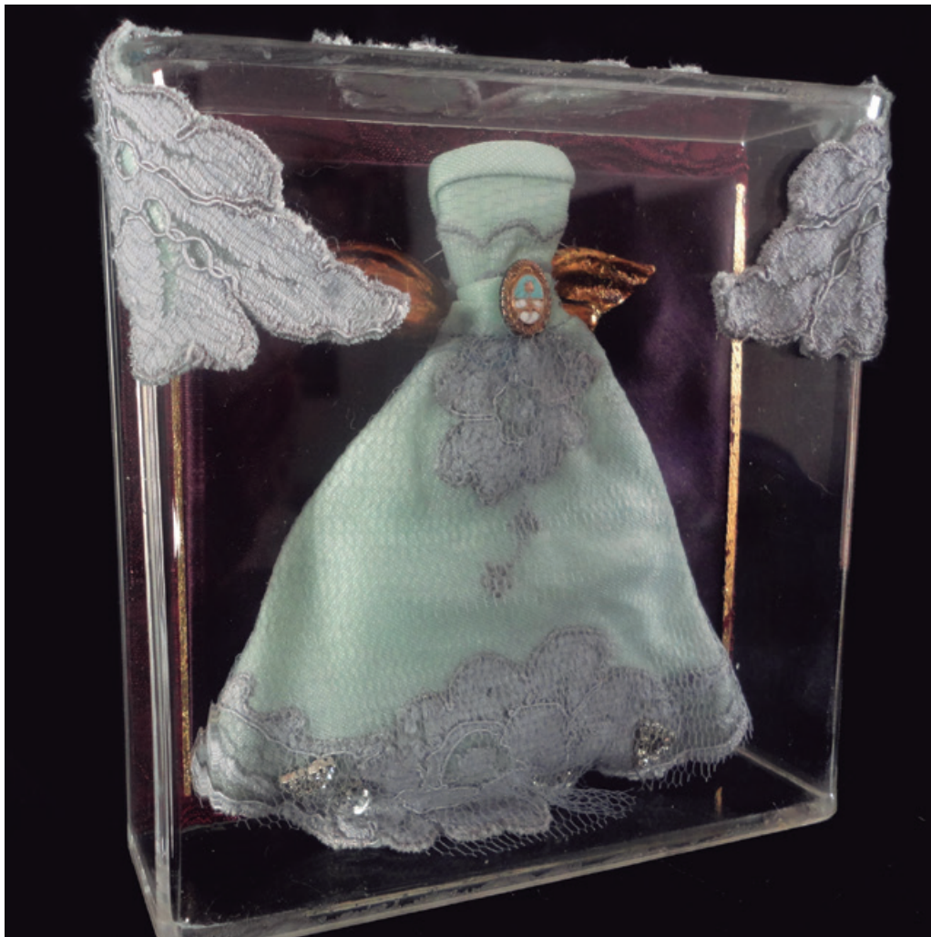
12 x 12 cm, puntilla-dorada a la hoja, 2016.