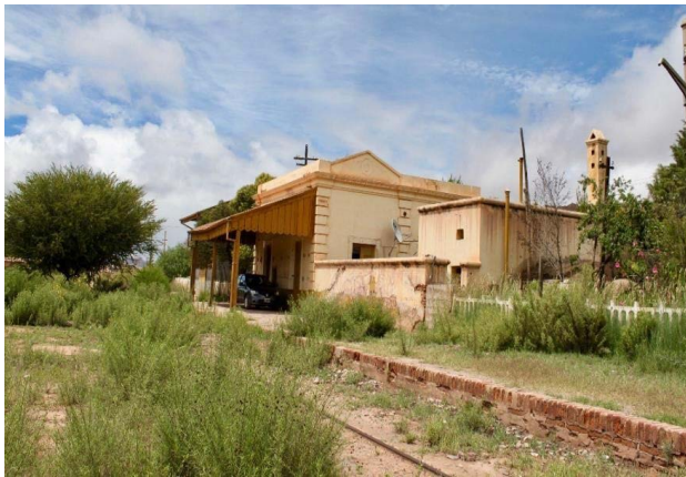
Figura 7. Ocupación de la estación de Uquía