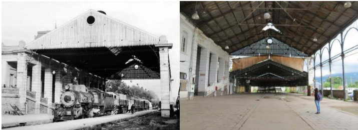
Figura 8. Estación de San Salvador de Jujuy. Antes y en la actualidad

treras, en el galpón que sería la zona de andenes, se habilitó un gran playón de cemento con escenarios de un lado y del otro.