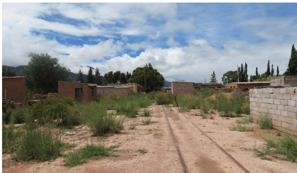
Figura 11. Asentamientos sobre las vías del ferrocarril Estación Uquía. 2018

Contrariamente a lo que sucede en las estaciones de San Salvador de Jujuy y Volcán, las estaciones de Uquía y Humahuaca presentan una ocupación por parte de la población de las instalaciones ferroviarias, abandonadas en su momento, con un nivel altísimo de destrucción de todo el espacio ferroviario. Tanto en Yala, como en Uquía, por ejemplo, los edificios “de pasajeros”, así como las casas de los empleados están utilizados como viviendas y en el pórtico se estacionan los automóviles entre laberintos de tiendas o tinglados de venta de alimentos y artesanías. El estado de estas construcciones no es bueno, las paredes se encuentran muy deterioradas, los pórticos desvencijados y hay gran crecimiento de la vegetación en las vías, los cercos y alrededor de los inmuebles. En Uquía, particularmente, se observó un importante asentamiento de casas de familia sobre las vías, algunas algo precarias de chapas y madera, y otras de material, muchas en construcción. Ya en 2017 se advertía sobre los desafíos del avance del Plan Belgrano sobre las zonas ocupadas, situación que se produjo también en otras estaciones de ferrocarril (ver Figura 11).