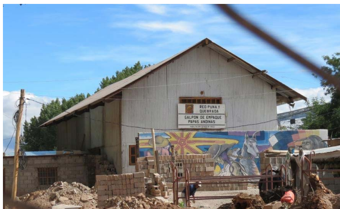
Figura 13. Galpón ferroviario. Estación Humahuaca

Lo que se ha podido identificar de la construcción original de la estación, en estilo inglés, se encuentra en muy mal estado, con poco mantenimiento, caída de material de construcción y piezas y elementos ferroviarios depositados en diferentes lugares en condición de arrumbe. Sí se ha podido observar que uno de los galpones que se encuentra por fuera de la feria está en buenas condiciones y utilizado como depósito de empaque de papas andinas de la Red Puna y Quebrada.