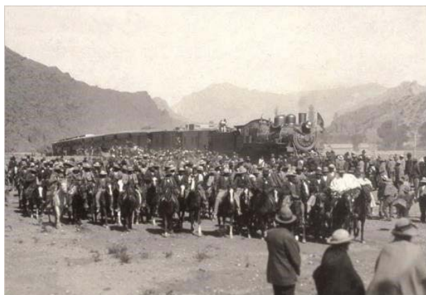
Figura 4. Inauguración del tramo ferrocarrilero La Quiaca-Tupiza el 10 de mayo de 1924