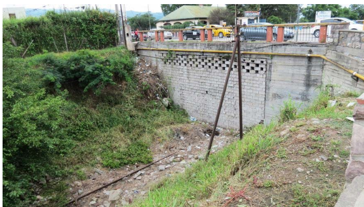
Figura 9. Paredón trasero del depósito ubicado bajo el puente lindante a la estación San Salvador de Jujuy y bloqueo de vías

conservación de algunos elementos ferroviarios como placas históricas y una balanza de cargas. Lamentablemente, el área de los talleres perdió por completo su fisonomía original.