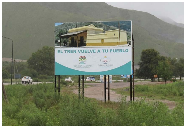
Figura 6. Cartel frente a la estación de Volcán