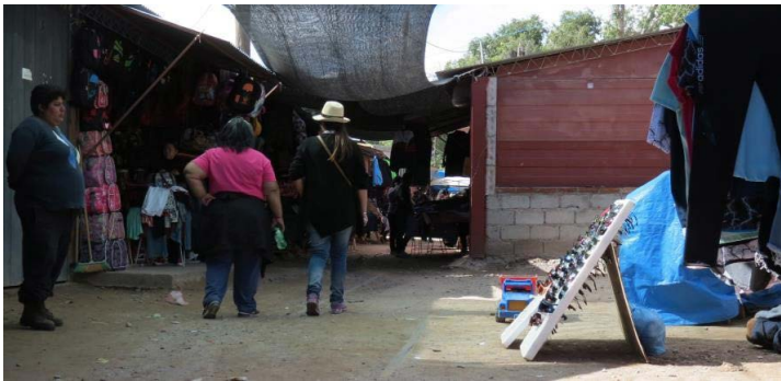
Figura 12. Feria y construcciones sobre las vías en la estación Humahuaca del ferrocarril

En la estación Humahuaca, por su parte, funciona hace más de una década una feria de artesanías y mercado, según testimonios. Esta feria se asentó sobre las vías del tren y los inmuebles del predio están habitados como casas de familia. Entre esta arquitectura se encuentran también las casas construidas para los empleados ferroviarios en la época de funcionamiento del ramal. En una de ellas, aún vive el último maquinista del tren de pasajeros de Jujuy a La Quiaca ( cf. Cicerchia et al. , 2021). En el recorrido por las inmediaciones, en un comienzo, fue difícil reconocer las estructuras originales de la estación de Humahuaca del ferrocarril, no solo por la instalación de la feria sino también por el tapeo que se realizó en algunos tramos de alambrados, rejas, paredes, que impiden el reconocimiento a primera vista de la estación. El espacio se encuentra modificado de tal manera que están completamente amalgamados la feria y el mercado con las viviendas y otras casas lindantes.