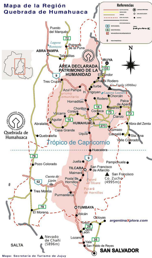
Figura 1. Mapa de la Región Quebrada de Humahuaca que recorre el tren a Bolivia, paralelo a la Ruta Nacional 9