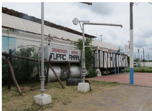
Figura 5. Parque recreativo en los talleres de San Salvador de Jujuy

En la estación central de San Salvador de Jujuy es posible comprobar la restauración de su fachada y la apertura de algunas oficinas destinadas a actividades culturales promovidas por la municipalidad. 3 En las instalaciones traseras encontramos dos espacios recreativos pertenecientes a la Corriente Clasista y Combativa, y los galpones y terrenos lindantes a la estación fueron convertidos en parque por la organización barrial Tupac Amaru, disponiendo de parrillas, un escenario para espectáculos, canchas de fútbol y una piscina. Frente la dispersión de la organización, el predio ya abandonado es mantenido voluntariamente por ex delegados. Hacia finales de 2017, el Club Gimnasia y Esgrima acondicionó relativamente la cancha de fútbol y la pileta, que desde entonces llevan los logos del club junto al de la Tupac.